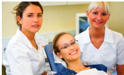
Regelmäßige Professionelle Zahnreinigung in der Praxis hält die Zähne hell und schützt vor Karies, Parodontose und Mundgeruch

Das hält nicht nur die Zähne länger hell. Es schützt sie auch vor Karies und Parodontose und es vermindert möglichen Mundgeruch .